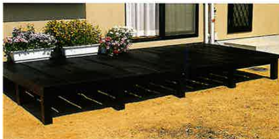
ガーデニング用板材