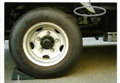
シャシースペーサー